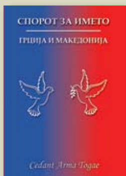
„Спорот за името меѓу Македонија и Грција“ – студентски проект на група студенти и проф. д-р Светомир Шкарик

Во последниве години, претпријатието стави акцент и на развојот и збогатувањето на издавачката дејност, за која цел е остварена поинтензивна соработка со научни и стручни работници, универзитетски професори и сл., а воедно за првпат во историјата на претпријатието, се издадени книги, од актуелна историска, научна и стручна проблематика.