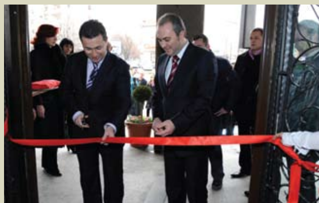
Отворање на Инфоцентар на ЈП Службен весник